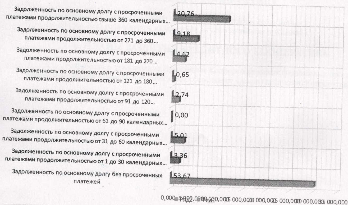
Задолженность по основному долгу по выданным займам

4.3. Структура задолженности выглядит следующим образом (см. диаграммы):